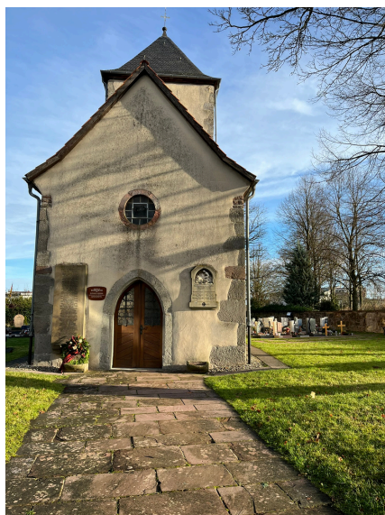
historische Wehrkirche (1386) Löschenrod