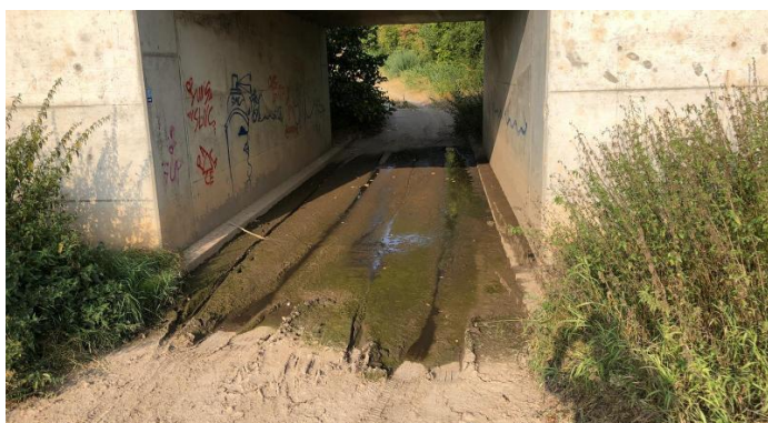
Bei der Bahnunterführung Richtung Ziegel wird aktuell an einer Grundsatzlösung gearbeitet.