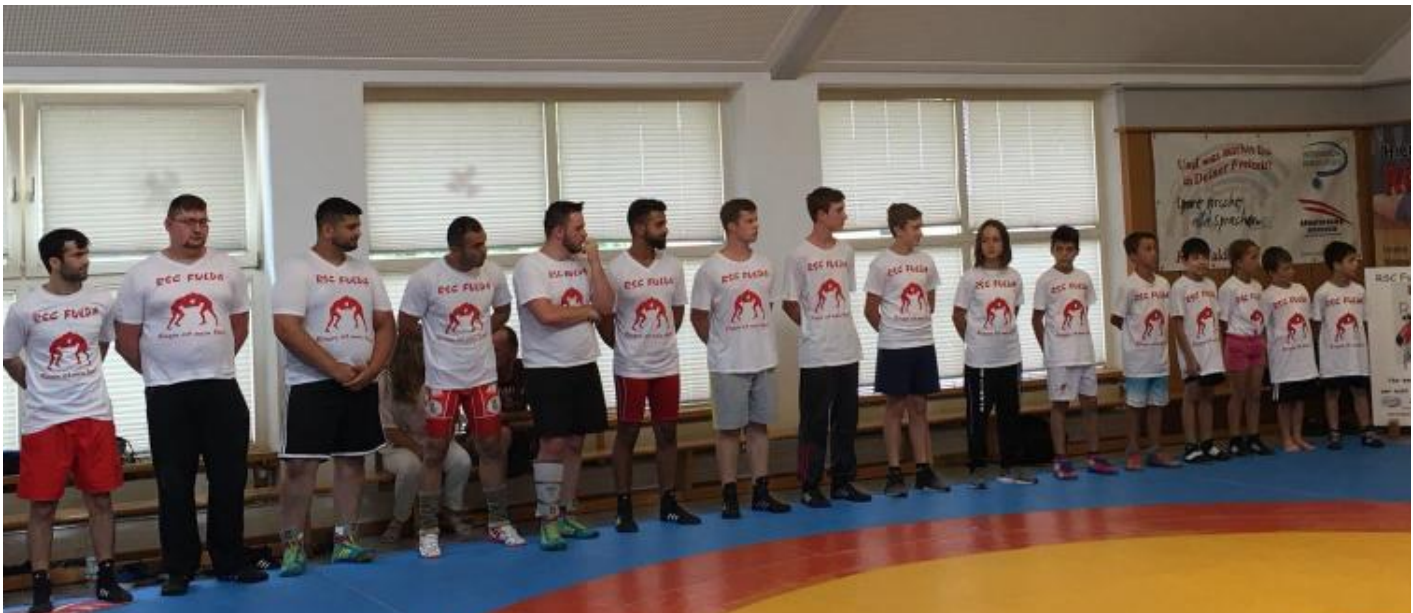
Die Mannschaft vom RSC Fulda stellt sich vor.