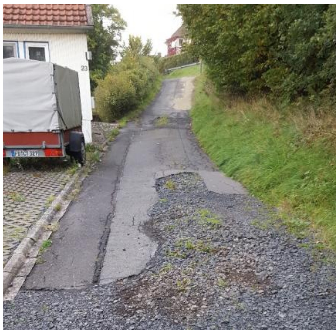
Die Restsanierung der Straße "Am Bornrain" soll in 2018 erfolgen

Mit freundlichen Grüßen Holger Breithecker Ortsvorsteher