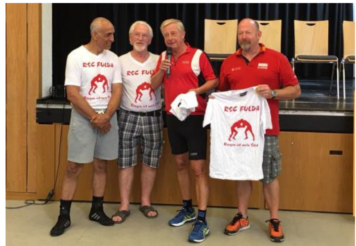
Bürgermeister Dieter Kolb lies es sich nicht nehmen den RSC Fulda persönlich zu begrüßen.