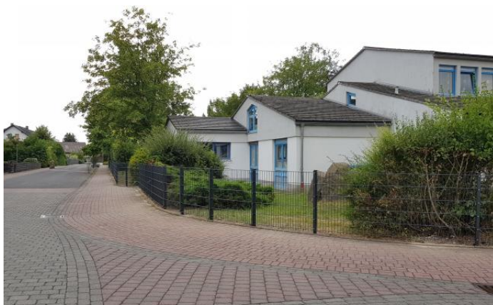
Die Zaunanlage am Kindergarten wurde erneuert.