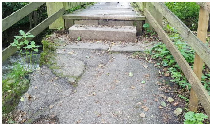
Bei der Sanierung der Brücke über die Fulda wird auf ein positives Kooperationsgespräch mit der Stadt gehofft.